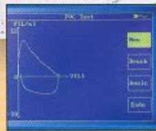
Display flow / volume chart