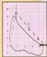
Print flow / volume chart